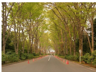
多摩御陵線ケヤキ並木

また、路線の南端に位置する「多摩御陵入口」交差点で交差する甲州街道（国道 20 号）のイチョウ並木も多摩御陵線と同時期に整備され、樹齢 80 年以上の大木が約 4 km の区間連なる都内有数のイチョウ並木として市民に親しまれている。