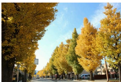
甲州街道イチョウ並木